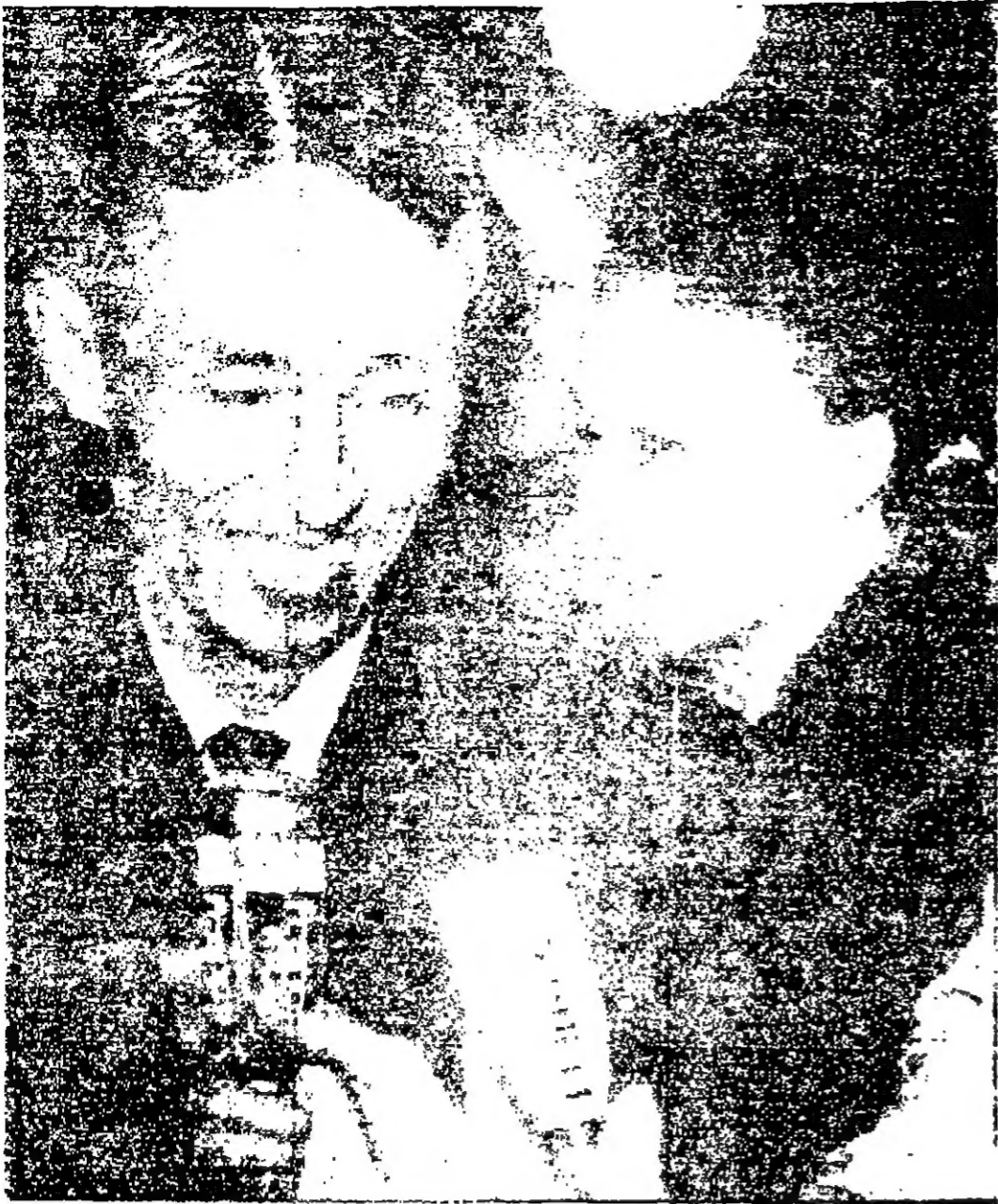
بار بونوم وزير الخارجية الفرنسي يترأس وفد بلاده في مؤتمر مدريد للسلام في الشرق الأوسط...